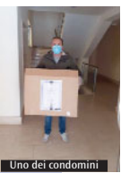
Uno dei condomini

collegamento ancora disponibile in rete, si è confrontato con Massimiliano Solinas, presidente dell'ufficio diocesano per la Pastorale sociale e del lavoro. L'incontro si è svolto lo scorso 30 aprile, vigilia della festa del lavoro e della ricorrenza di san Giuseppe lavoratore, ed è stato l'ideale introduzione alla veglia di preghiera, sempre in streaming, organizzata il giorno successivo nella