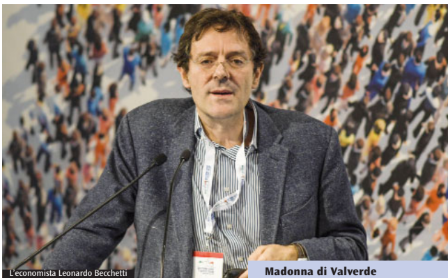
L'economista Leonardo Becchetti

Le politiche di resilienza, l'economia circolare, gli interventi dell'Europa, come superare le disuguaglianze